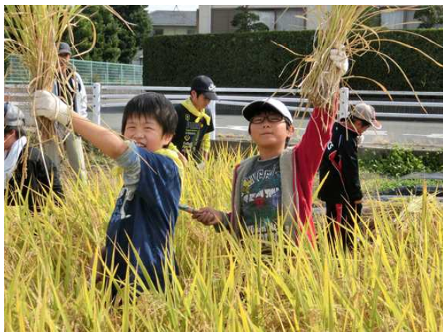
みんな、収穫の喜び